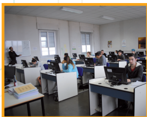
Uno dei tre laboratori informatici