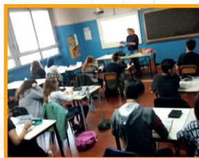
Un'aula didattica con videoproiettore