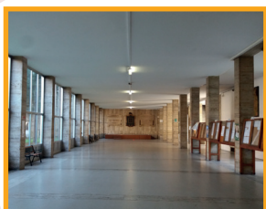
L'atrio della scuola