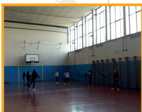
Una delle palestre