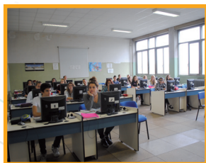
Il laboratorio linguistico

La scuola finalizza la propria azione al raggiungimento del successo scolastico e formativo dei suoi studenti, al miglioramento della qualità degli apprendimenti e dell'offerta formativa.